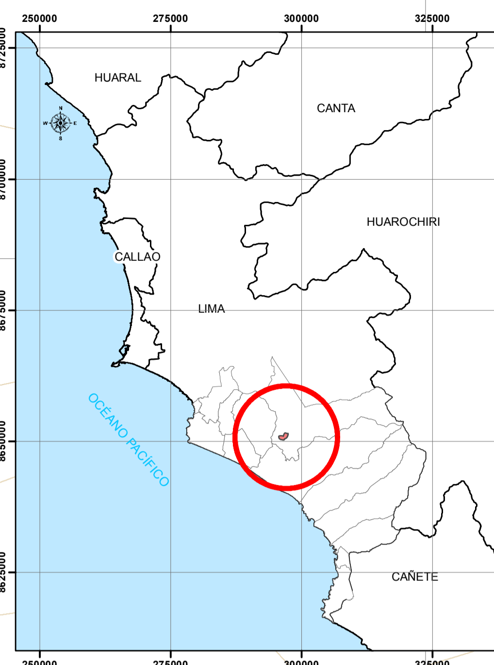
MAPA DE UBICACIÓN DEL ESTABLECIMIENTO DE SALUD ESCALA 1 : 700 000