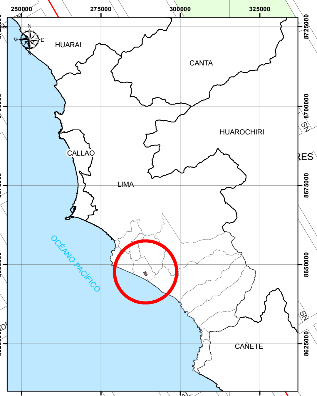
MAPA DE UBICACIÓN DEL ESTABLECIMIENTO DE SALUD ESCALA 1 : 700 000