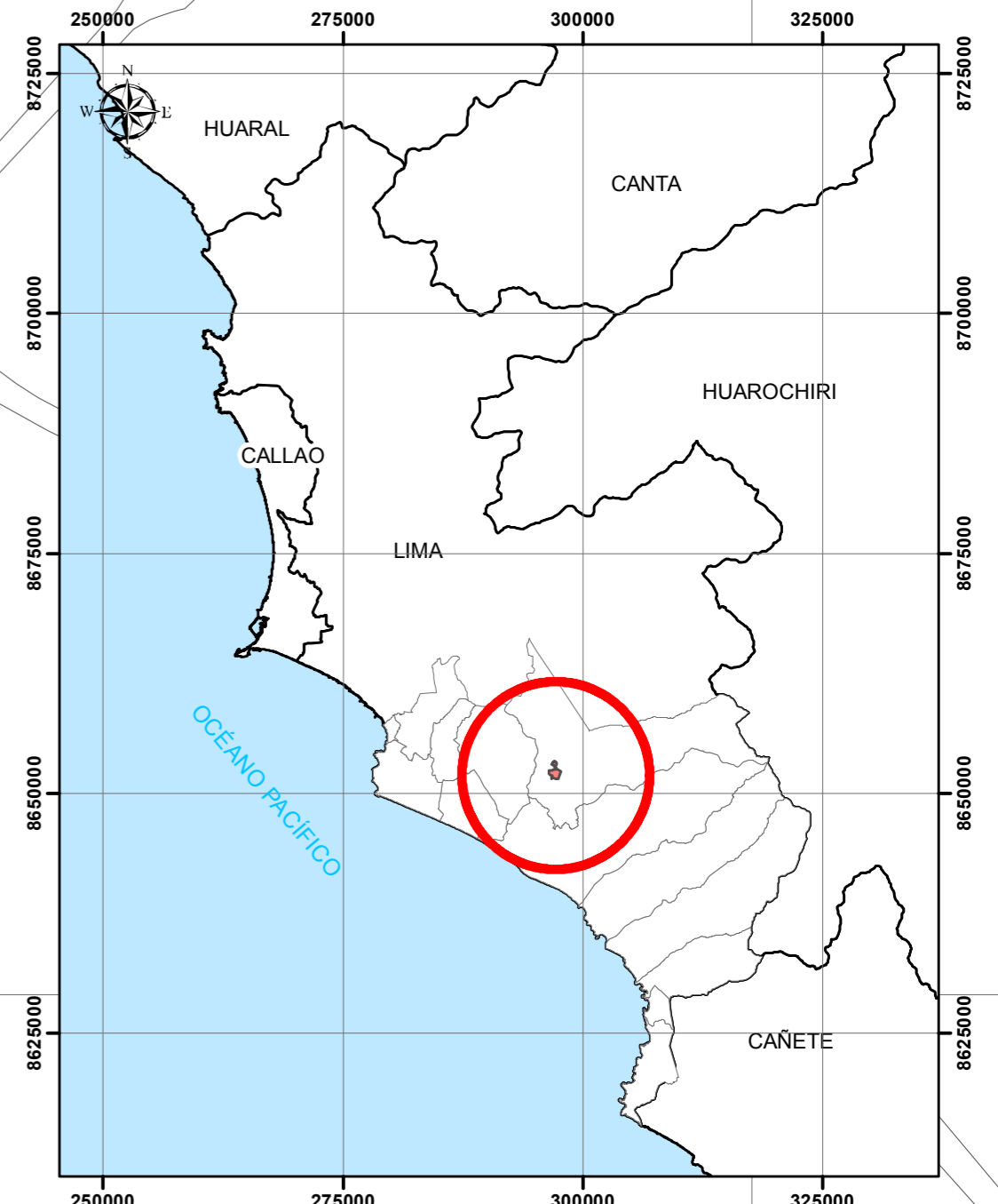
MAPA DE UBICACIÓN DEL ESTABLECIMIENTO DE SALUD ESCALA 1 : 700 000