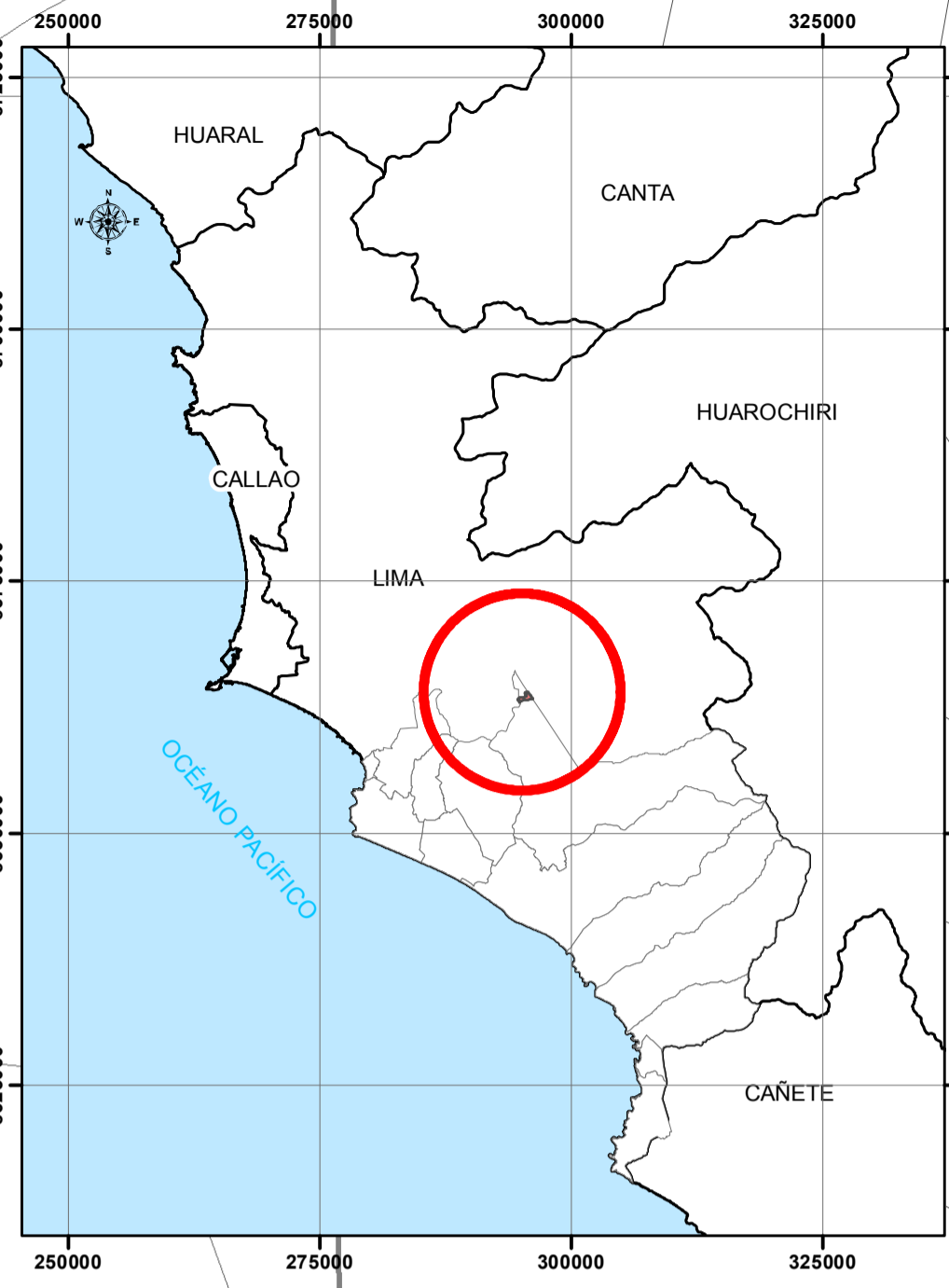
MAPA DE UBICACIÓN DEL ESTABLECIMIENTO DE SALUD ESCALA 1 : 700 000