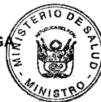
CARLOS ALBERTO TEJADA NORIEGA Ministro de Salud