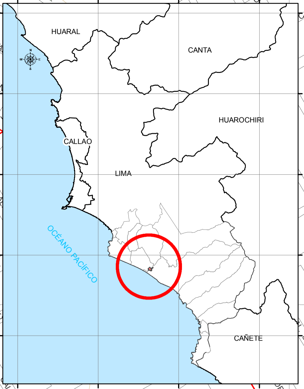
MAPA DE UBICACIÓN DEL ESTABLECIMIENTO DE SALUD ESCALA 1 : 700 000