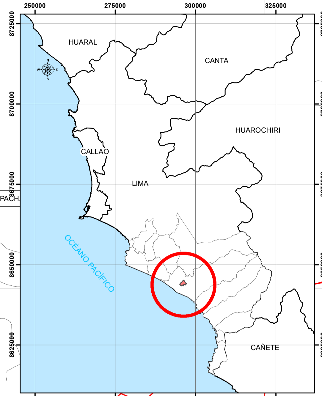
MAPA DE UBICACIÓN DEL ESTABLECIMIENTO DE SALUD ESCALA 1 : 700 000