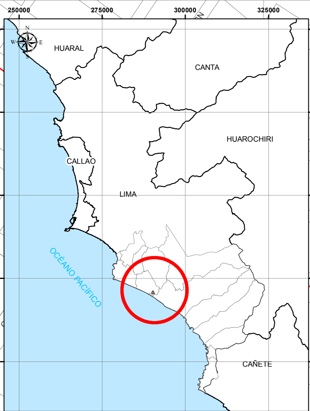
MAPA DE UBICACIÓN DEL ESTABLECIMIENTO DE SALUD ESCALA 1 : 700 000